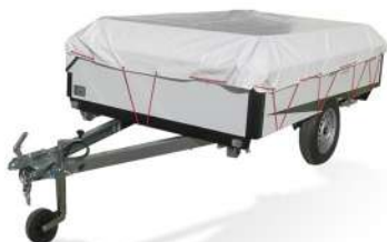
Bâche de transport / parking Transport-/Parkplane