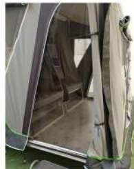
Moustiquaire porte Moskitonetz Tür