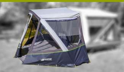
Auvent / Vorzelt