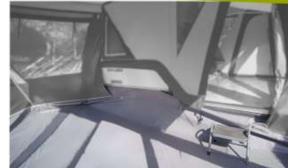
Sol auvent en PVC ou bolon/ Vorzeltboden aus PVC oder Bolon