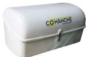
Caisse de timon Deichselkasten