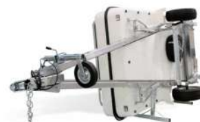
Support de stockage Seitenlagerbügel

Plus d'accessoires sur demande / Weiteres Zubehör auf Anfrage