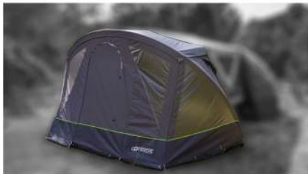
Auvent arrière / Anbauzelt hinten